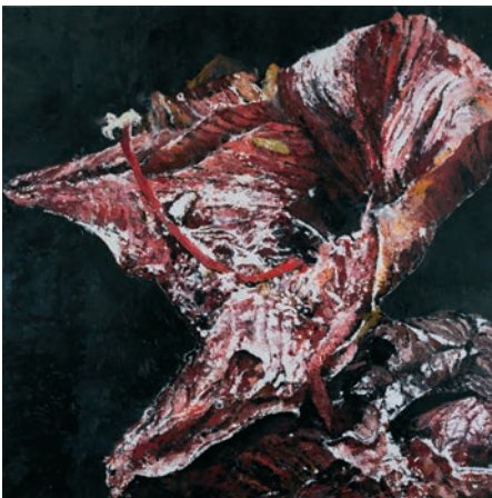
Philippe Cognée, Amaryllis rouge 2 , 2018 ©Adagp, Paris, 2022 / Courtesy Philippe Cognée et Templon, Paris – Brussels.