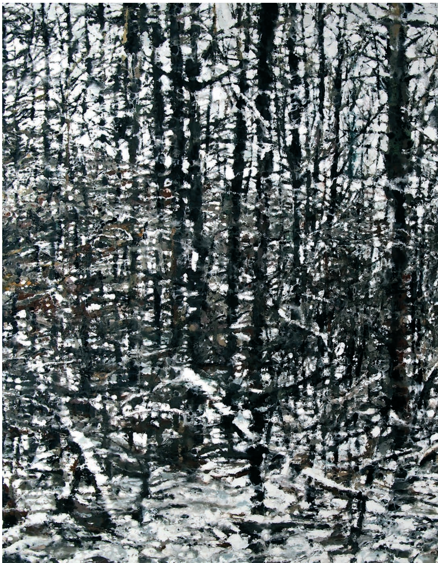
Philippe Cognée, Forêt enneigée 1 , 2020 ©Adagg, Paris, 2022