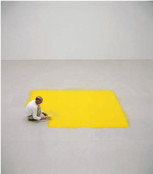
6] Wolfgang Laib , Brahmanda , Février 2016 ©Wolfgang Laib