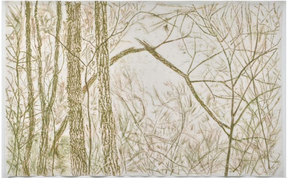
Giuseppe Penone, Vert du bois , 2017 ©Adagp, Paris, 2022 © Archivio Penone