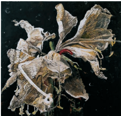
Philippe Cognée, Amaryllis blanche 3 , 2019. ©Adagp, Paris, 2022 / Courtesy Philippe Cognée et Templon, Paris – Brussels.