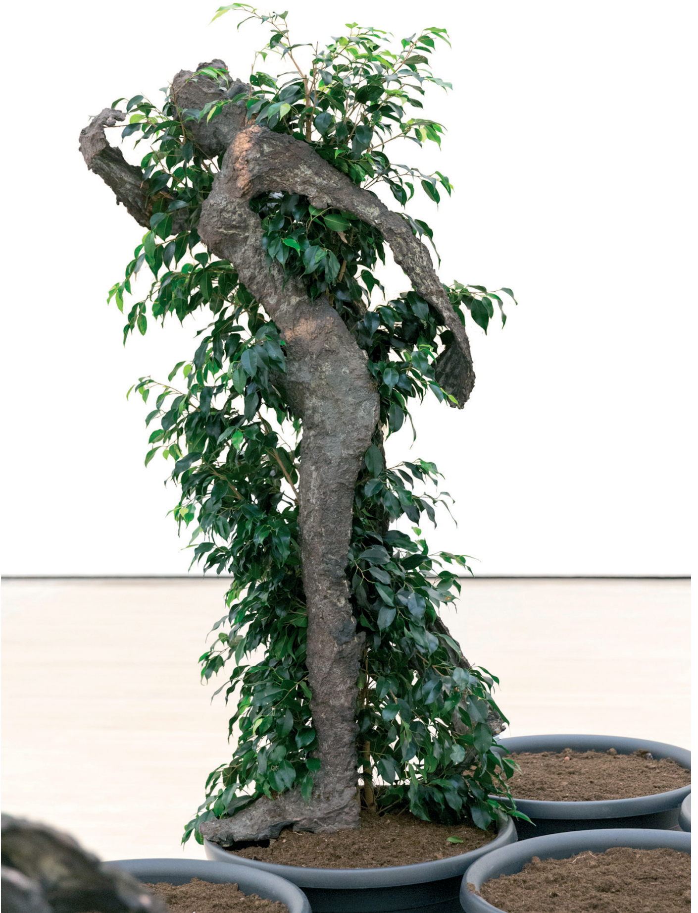
Giuseppe Penone, Geste végétal , 1983 ©Adagp, Paris, 2022 © Archivio Penone