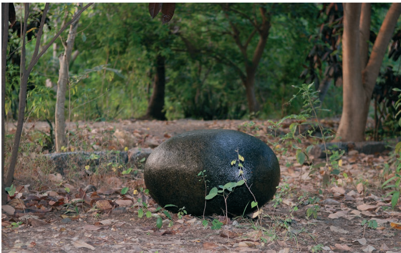
Wolfgang Laib, Brahmanda , Février 2016 © Wolfgang Laib