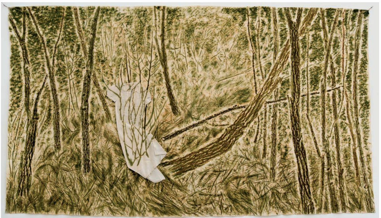
Giuseppe Penone, Vert du bois avec chemise , 1984 ©Adagp, Paris, 2022 © Archivio Penone