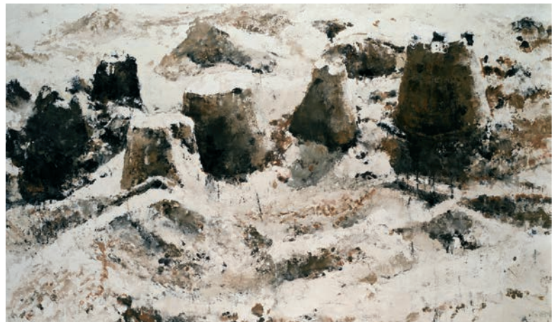
Philippe Cognée, Châteaux de sable 3 , 2011