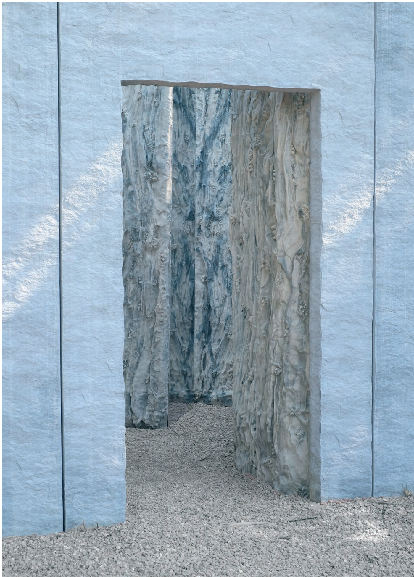
Cristina Iglesias, Chambre minérale humide , 2022 ©Adagg, Paris, 2022 Crédit Photo Estudio Cristina Iglesias