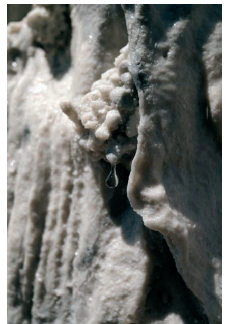
Cristina Iglesias, Chambre minérale humide , (détails) 2022 ©Adagp, Paris, 2022